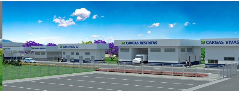
Projeto do novo complexo logístico de Vitória

A té 2017, a expectativa é de que a Rede de Terminais de Logística de Carga da Infraero movimente 3,4 milhões de toneladas de carga, entre produtos importados, exportados, cargas courier e nacional. Com foco nesse crescimento, a Infraero investe na operacionalidade da Rede Teca e coloca em prática seu plano de investimentos 2012-2016 que prevê ampliações e modernização de áreas de armazenagem.