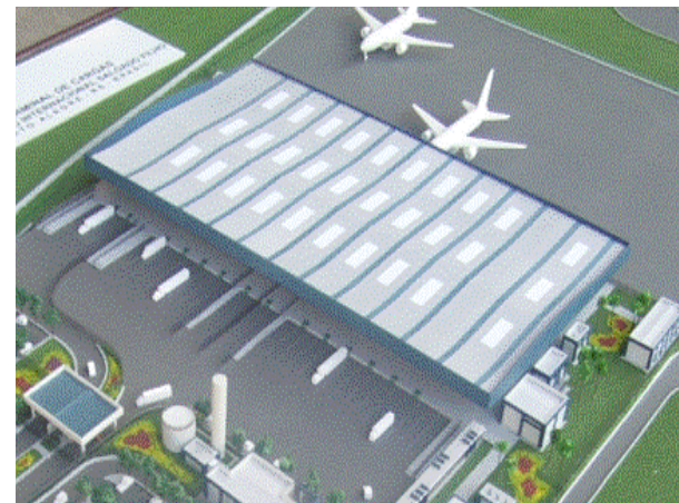
Maquete do Teca de Porto Alegre

de 2012; e o de Salvador (BA) que passará por reforma e expansão ainda neste ano. Para 2013, está programada a entrega do segundo terminal de carga e um estacionamento de caminhões em Goiânia (GO), enquanto em 2014 serão entregues as obras de reforma e ampliação do Teca de Navegantes (SC).